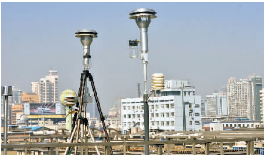
11月1日,长沙市环保局环境监测站六楼楼顶的火车新站子站PM2.5检测站,刚安装完毕的PM2.5检测仪器正在运行。