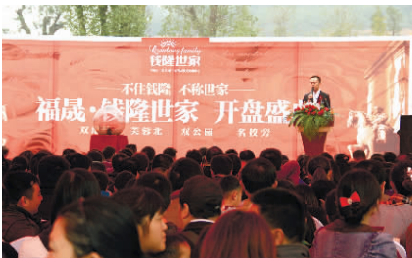
福晟·钱隆世家项目开盘现场。

在长沙，滨江豪宅备受关注的同时，世家项目打造了长沙“公园地产”的新篇章。西南面600多亩的秀峰山公园，西北面1398亩的鹅羊山公园，加之项目内部配套的3万平方米私家山以及18万方的地中海风情园林，可以说是天然氧吧集于此。