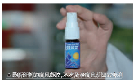
最新研制的痛风凝胶,不吃药治痛风获国家专利

痛风不用再吃药,只需轻轻一抹就能止痛、降尿酸。日前,上海中医药大学最新研究已被转化为科技成果在辽宁上市。