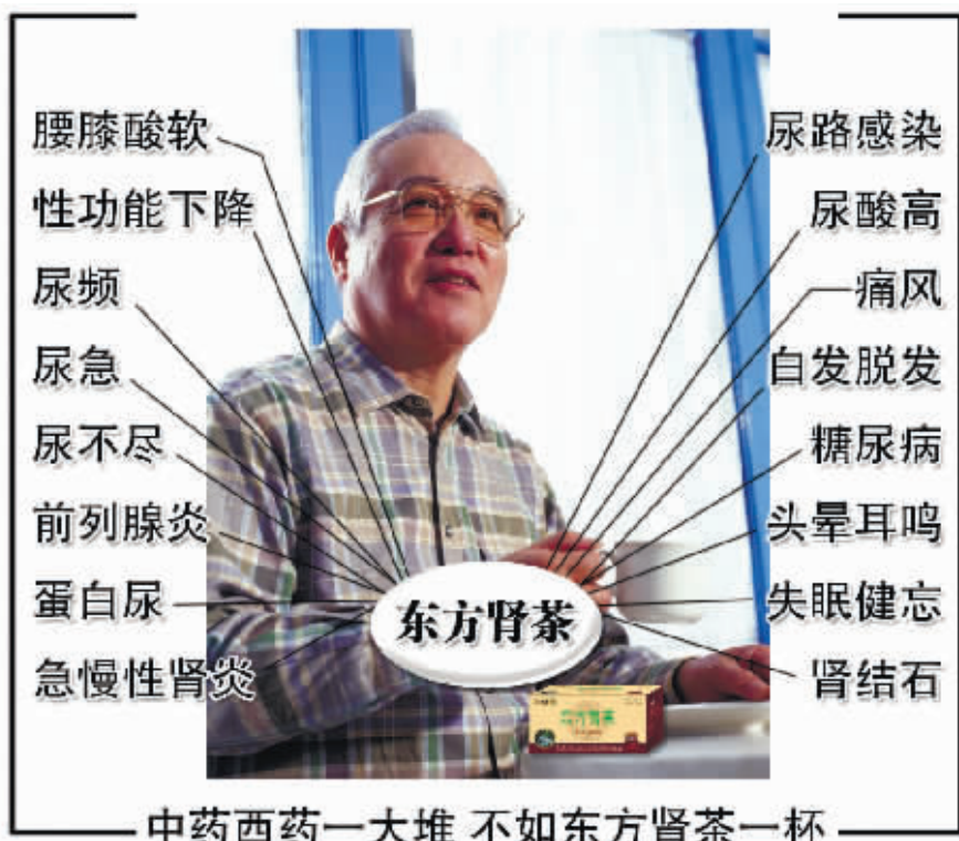
中药西药一大堆 不如东方肾茶一杯

只有4月份才能采摘并经36天自然阴干才能用作原料，所以原料非常稀缺。只有那种常年高海拔、高日照、高温差、高温湿、无污染的天然环境中生长的肾茶才是上等肾茶，目前世界上只有香格里拉野生肾茶属于上品肾茶，才具有丰富的营养和药用价值。