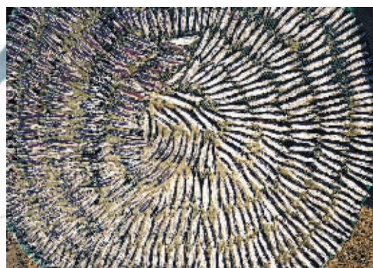
正在晾晒的小鱼，看上去像客家人的“围屋”。