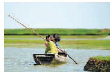
撑船不是那么简单，使足了劲，还是在湖中心打转转……

“芦苇深花里，渔歌一曲长。”正是芦花飘荡的季节，“湖湘植物志”访秋活动第二站——岳阳洞庭湖，芦苇荡。