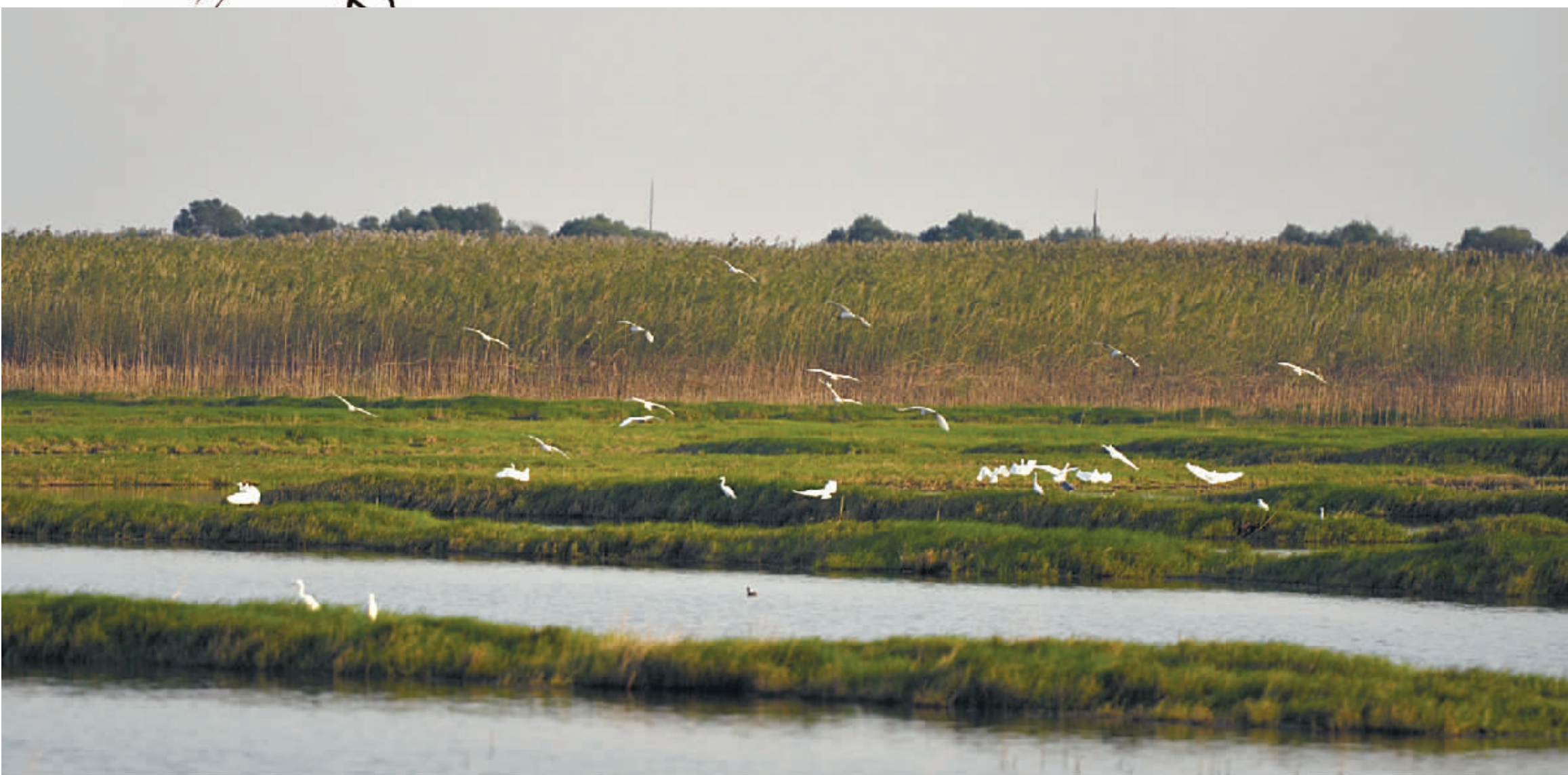
湖区、湿地有着丰富的自然景观，白鹭、野鸭、大雁、各种鱼类……天地精灵都在舒展自己的生命脉络。