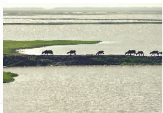
洞庭湖里暮归的水牛。