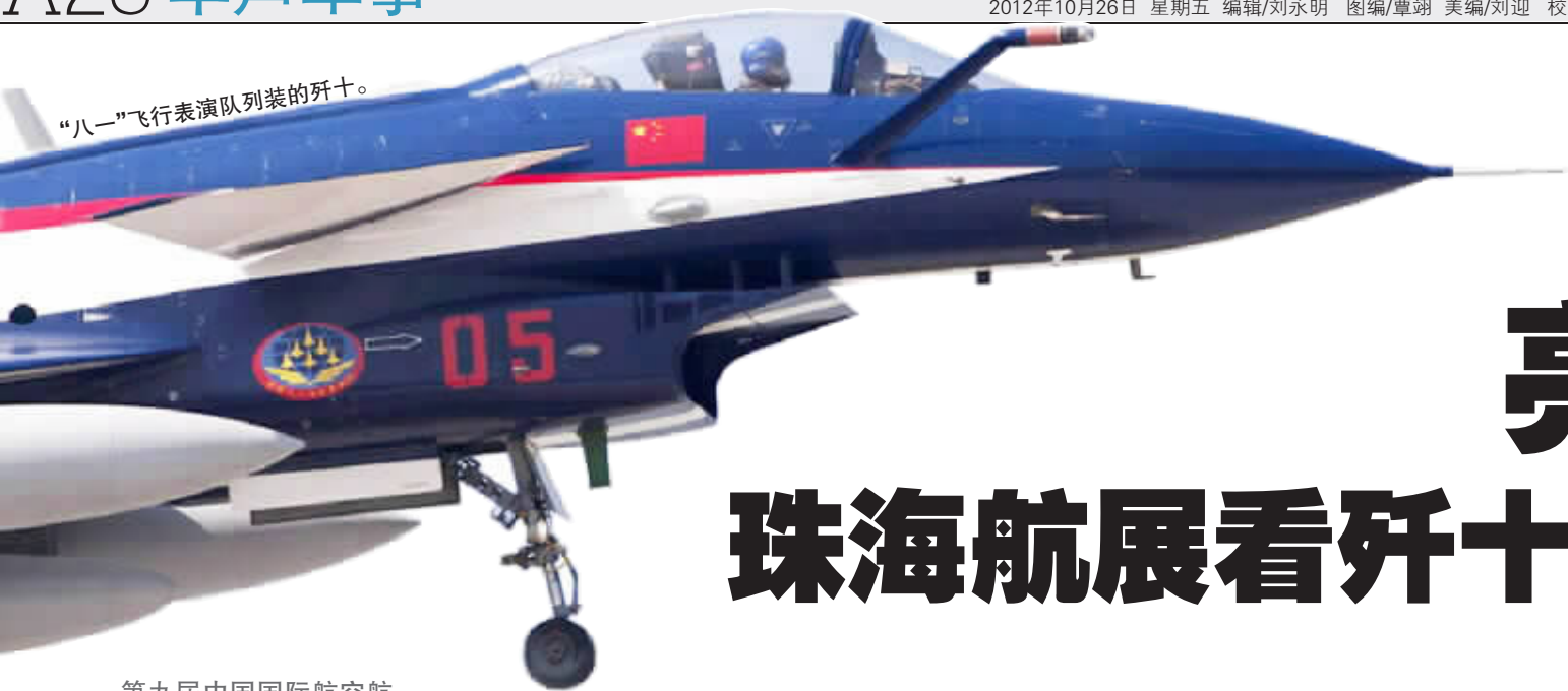
“八一”飞行表演队列装的歼十。