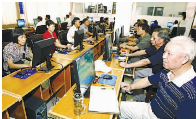
学电脑玩上网赶潮流,不仅是年轻人的专利,老年人同样可以。