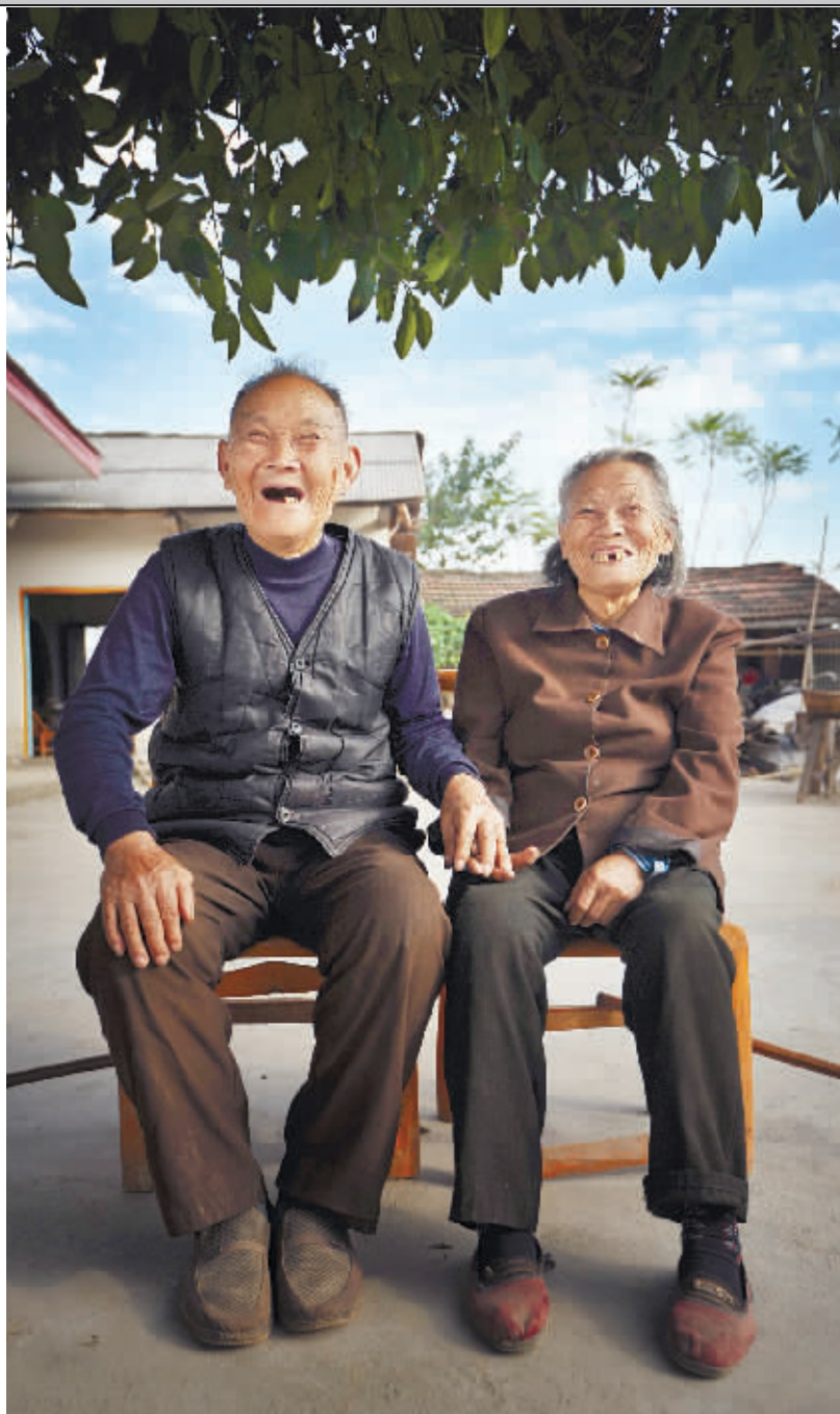
老两口没事就坐在屋前禾场上晒太阳。邻居说：“两位老人都百岁了，是我们的‘宝’。”