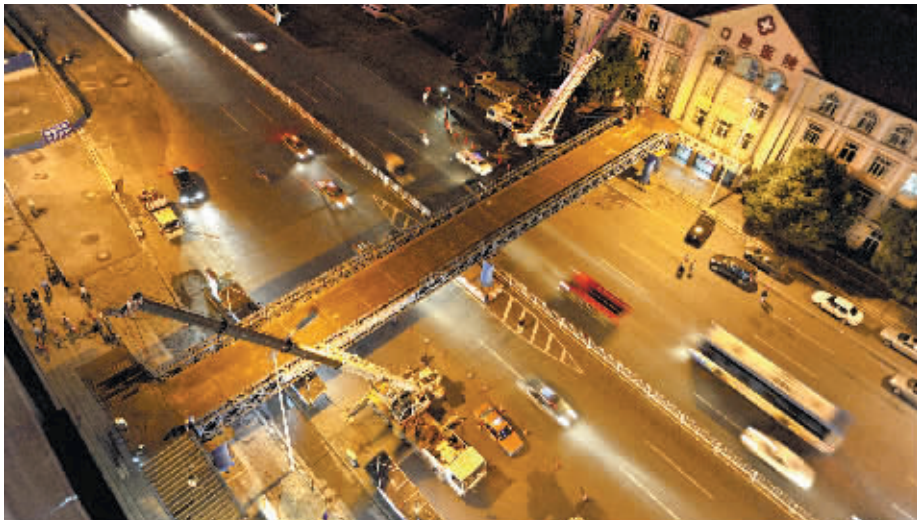
10月22日晚,长沙市五一大道,几台大吊在南北两侧同时施工,将拆下的钢便桥吊入工程车上运走。