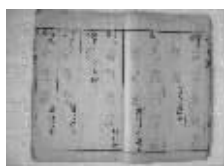
道家养生《广成子回春养命术》

如果单纯补阴就会出现畏寒畏冷、阳痿现象，单纯壮阳就会出现口舌生疮、血压升高、极易容易出现身体被掏空、要性不要命的现象。福鹿丸内调脏腑、外调经络，阴阳双补，克服了以往只采阳不补阴弊端，从而达到滋阴、补阳的全面功效。