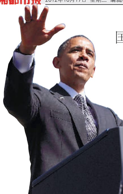
奥巴马在竞选集会中演讲。