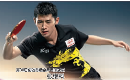
第30届伦敦奥运会乒乓球冠军 张继科