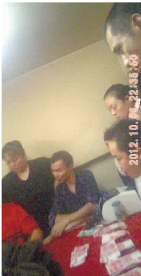
10月9日晚,长沙市书院路,记者暗访地下赌场。(非正常拍摄)