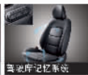
真皮座椅记忆系统