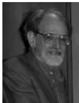
罗伊德·沙普利(出生于1923年6月2日) 美国杰出的数学家和经济学家。他在数理经济学，尤其是博弈论领域有着重大贡献。