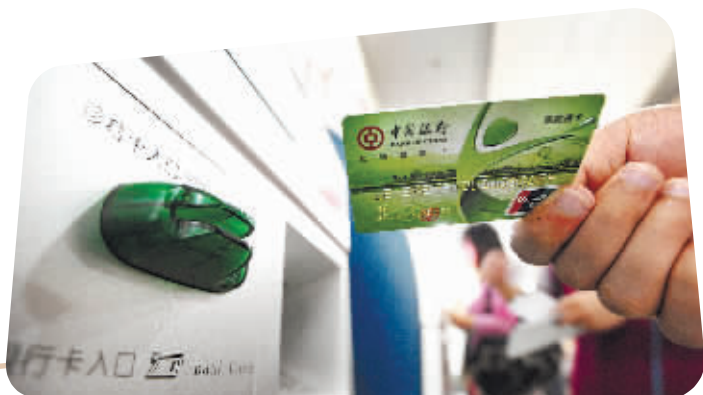
市民用长城健康卡在医院终端机上预约挂号

近日记者从中行湖南省分行获悉,中行面向长城环球通白金卡客户正式推出信用卡虚拟卡产品,持卡人可通过拨打中行白金卡贵宾专线(40066-95669)申请开通虚拟卡。后续,将逐步覆盖全信用卡产品线,持卡人可以在中行信用卡“缤纷生活”手机客户端、中银积分365网站、网上银行和手机银行等多种渠道高效便捷地申请定制自己的虚拟卡服务。