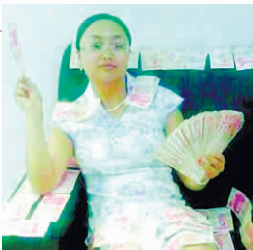
相颇为相似引发“传言”。炫富女子与女县长(左下)长

中国新闻网刊:【6次破格提拔湖北80后女县长再曝炫富照】 近日,湖北通山县农民工致该县女县长的公开信曝出女县长胡娟8年提拔7次就有6次破格,引发网友热议。10日,网上又曝出疑似该县女县长炫富照。当地宣传部门否认炫富照系胡娟。