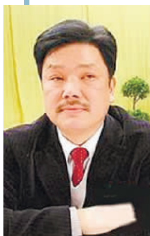
一不小心,副县长的胡须成了热议话题。

在我看来,与时俱进地允许官员留胡须,天塌不下来,反而可改变官员形象千人一面、共性大于个性、距离群众较远的局面,让更多个性官员手持胡须行政,成为我国政坛上一道别样的风景。