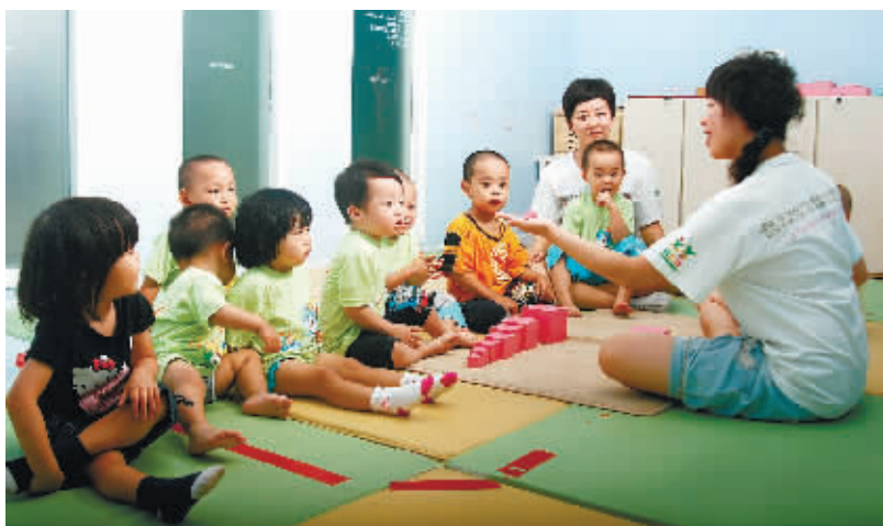
近两年,我省共投入7.9亿元,新增幼儿园1166所,新增学位21万个。

2011年,全省义务教育阶段学校14134所,比2007年减少4027所,高中阶段学校1161所,比2007年减少320所,普通高等学校105所,比2007年增加6