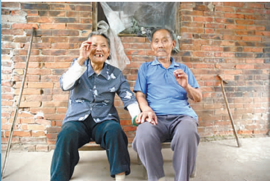
在与记者谈话中,两位老人一直手拉着手。100岁的他们,已经这样牵手走过了78载岁月。

如今的社会物欲横流,就连恋爱、婚姻也充斥着铜臭、利益的味道。百岁夫妻的故事或许是平淡的,但他们的真爱让所有人动容,让我们每一个人感受到真情的宝贵。