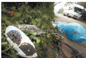
10月9日,长沙县暮云镇暮马路许桥村路段,摩托车零件散落一地。

本报10月9日讯 砰!一辆由西往东行驶的201路专线中巴车在上坡超越一辆三轮车时,与一辆女式摩托车迎面相撞,摩托车女驾驶员当场死亡。这是今晨7时许发生在长沙暮云镇暮马路许桥村路段的一幕。