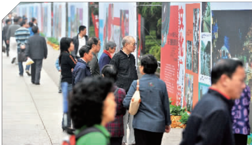
10月9日上午,“喜迎十八大,镜采三湘巨变”图片展在湖南烈士公园南门展出。