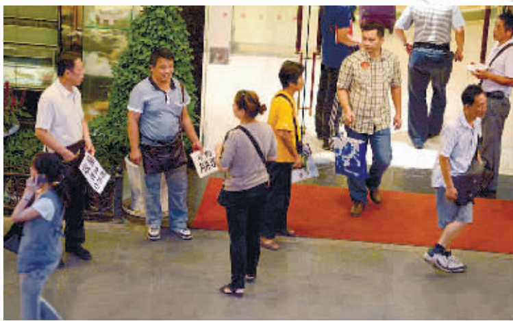
武汉某酒店门口聚集的月饼票贩子。