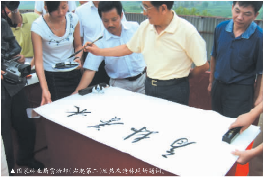
▲国家林业局贾治邦(右起第二)欣然在造林现场题词。

区林业局在区委、政府的坚强领导下,在上级主管部门的精心指导和大力支持下,全面落实科学发展观,认真贯彻落实区委经济工作会议精神,紧跟区委政府“项目立区、工业强区、城镇兴区、商贸活区”发展战略,围绕“兴林富民”这一主题,稳步推进现代林业建设,林业资源培育和林业产业得到较快发展,各项中心工作成效明显。