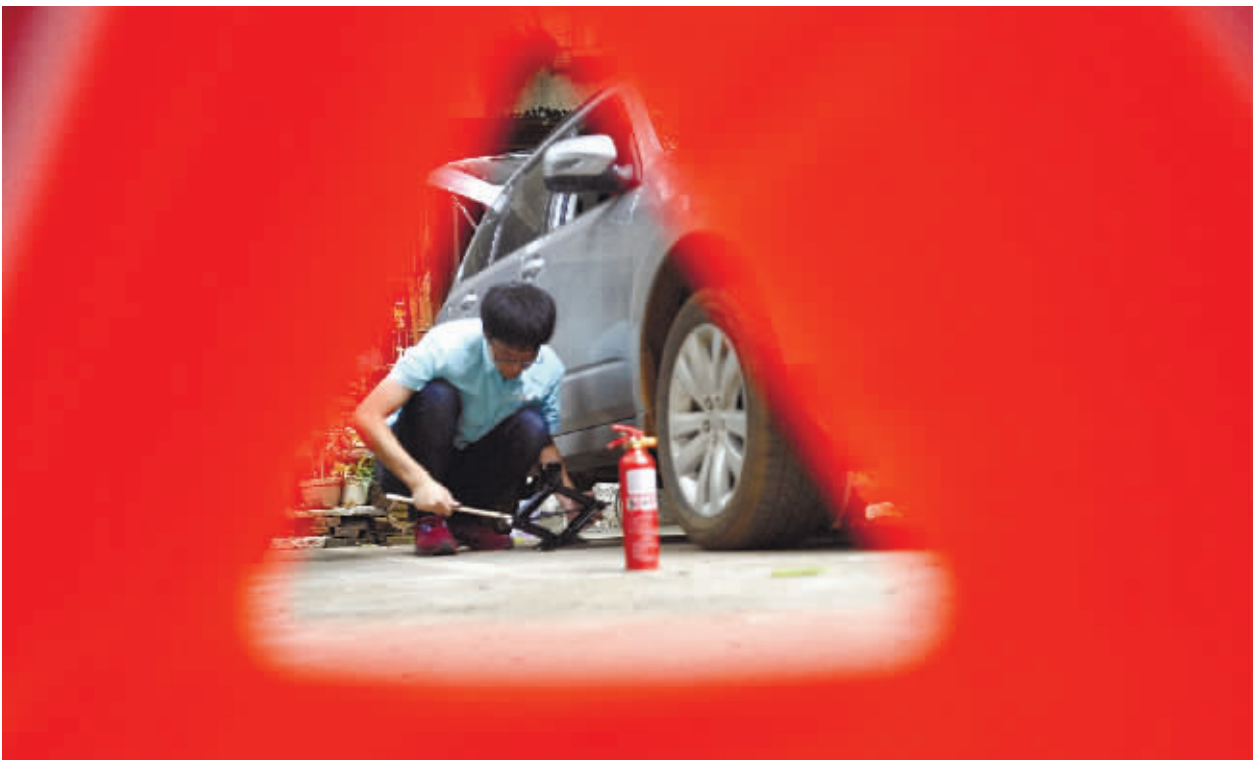
长假出行前，先对自己的爱车进行一次全面的检测。