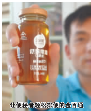
让便秘者轻松排便的金百通

金百通中短链益生元 FOS,源自天然植物原料,经先进的酶生物工程提炼而来。其天然微量存在于燕麦、燕麦、香蕉等几千万种植物中,能迅速增值双歧杆菌150倍,乳酸菌18倍以上。同时双向调节肠道菌群平衡,促进肠道蠕动。实现一通、二润、三调,被誉为“肠道保姆”,安全性举世公认。不管是几十年的顽固型便秘,老年习惯性便秘、孕期便秘还是泻药依赖型便秘,金百通,一通百通,健康轻松。因其调节肠道菌群,润肠通便的奇特效果,已通过国家食品药品监督管理局批准,率先进入湖南市场。目前,长沙东塘星城(养天和)大药房、五一一路平和堂大药房、衡阳:国大药房(解放路附二医院旁)、常德:战备桥大药房(红绿灯十字路口)已引进“金百通低聚果糖果液”,您可拨打“肠道年轻工程”专线:0731-89721579 咨询订购。现在订购可享受买2赠1的优惠(赠品为100ml,活动仅限3天)。