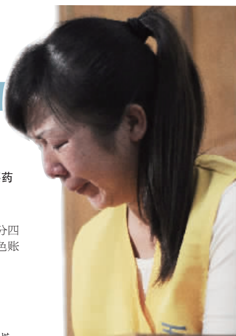
9月22日,长沙市第一看守所,一名女“医托”流下悔恨的眼泪。

提醒 克服“病急乱投医”的心理,不要搭理陌生人的搭讪。 就医时遇到困难应及时向医院门诊咨询台及分诊、导诊工作人员询问。 不与陌生人接触,不轻信他人,若遇“医托”纠缠请马上报警。