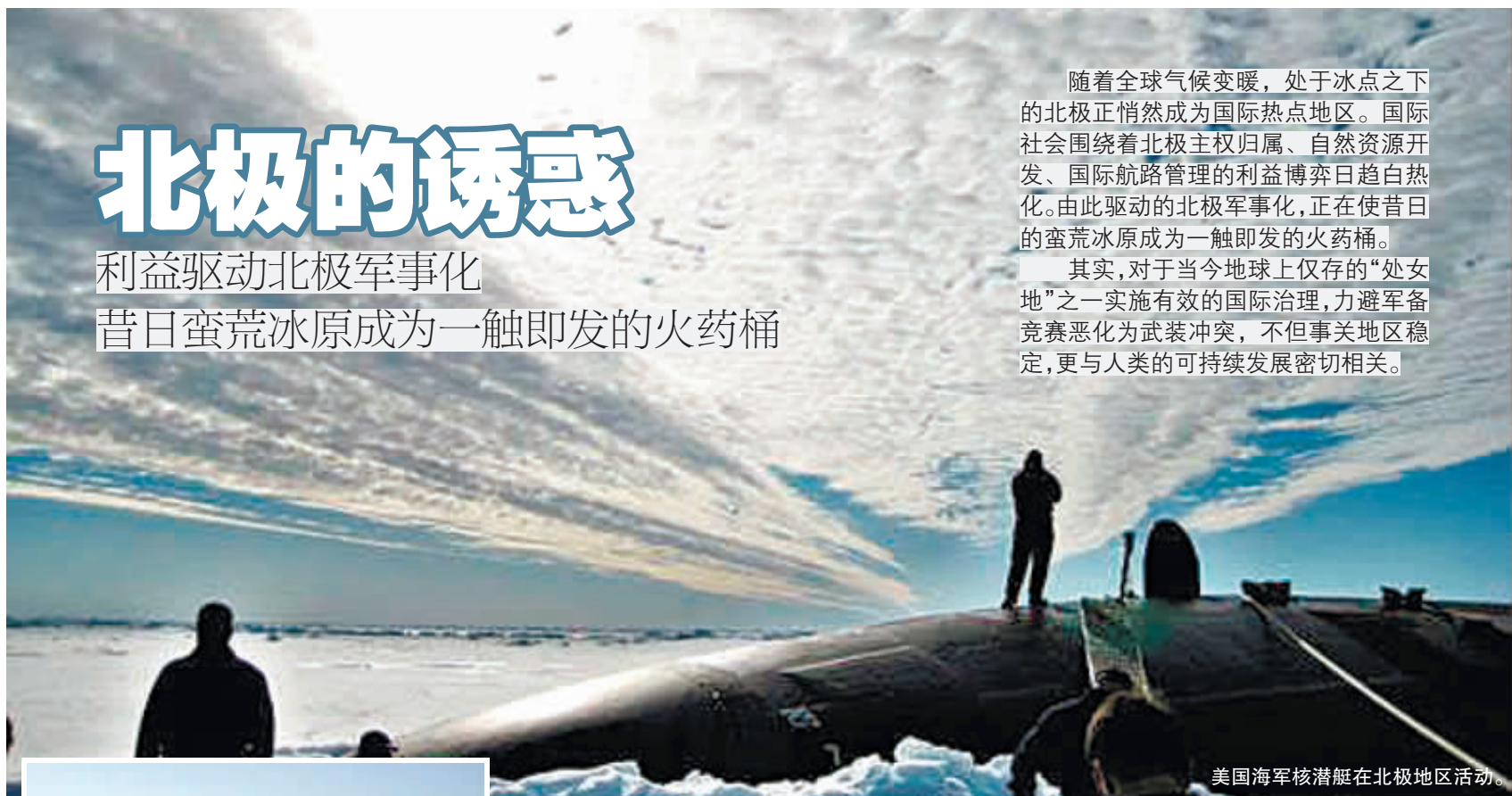
美国海军核潜艇在北极地区活动。