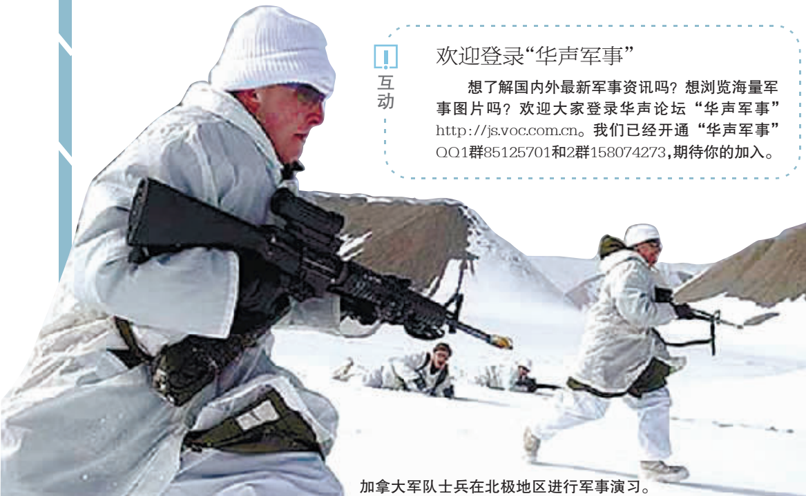
加拿大军队士兵在北极地区进行军事演习。

想了解国内外最新军事资讯吗？想浏览海量军事图片吗？欢迎大家登录华声论坛“华声军事” http://js.voc.com.cn 。我们已经开通“华声军事”QQ1群85125701和2群158074273，期待你的加入。