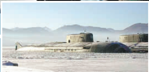
俄罗斯核潜艇在北极活动。