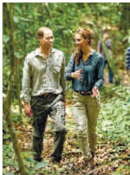
9月15日，英国威廉王子(左)和凯特王妃在马来西亚沙巴州丹浓谷保护区内游览。

法国一家法院18日作出裁定，娱乐杂志《靠近》不得继续刊登和出售含有英国威廉王子夫妇隐私照的期刊，必须在24小时内向当事人移交所有照片的数码版本，不得转售。