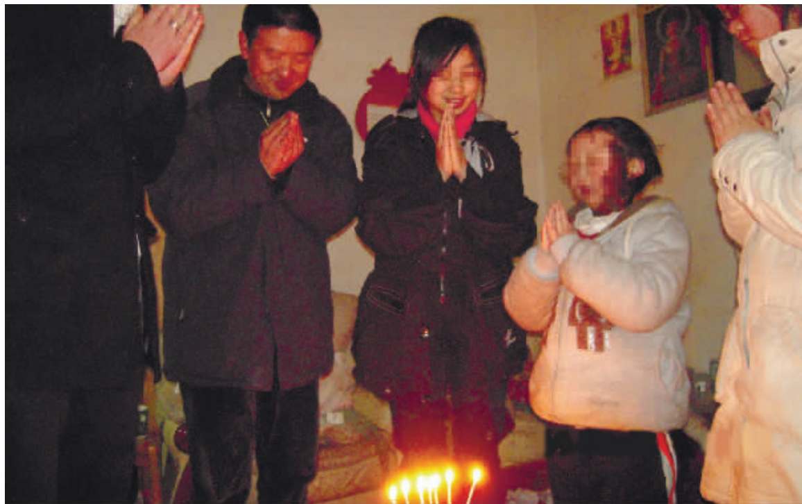
一位13岁的小女孩罹患下窝肌纤维母细胞瘤,于2010年4月份去世。去世前,宁养院医护人员和义工一起给她办了个生日会。

有一次我出差去外地了,社工打电话告诉我要探访一个病人,我说我老婆去可以不,邹医生说也可以,后来我老婆过去一看,是个女肺癌病人,和丈夫住在一起,家里又脏又乱,病人头发乱蓬蓬的躺在一张床上,面无表情。她跟几个义工过去帮病人洗头发,喂水,翻身啊忙碌了一个下午,以后又连续几周去看她。这个女病人逐渐和我们建立了感情,会说谢谢,会笑了。