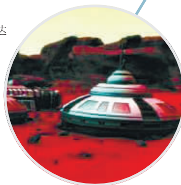
宇航员居住的火星基地概念图。

也有很多科学家认为,人类未来离开地球的原因,或许仅是为了保护地球免遭破坏,地球将变成一个自然避难所,人类可时常光临。 ■据北京日报