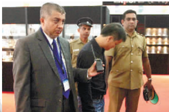
当地时间9月5日,一名32岁中国男子在斯里兰卡首都科伦坡珠宝展上吞下一颗价值1.3万美元的钻石。