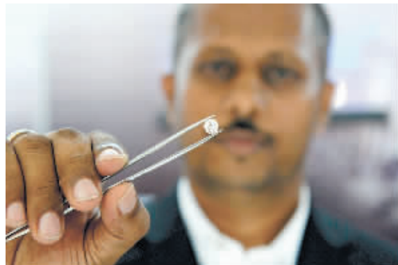
店主展示一颗钻石,称被中国男子吞下的钻石跟这颗大小差不多。