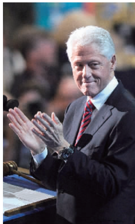
9月5日,在美国北卡罗来纳州夏洛特举行的民主党全国代表大会上,美国前总统比尔·克林顿发表演讲,支持现任总统奥巴马。

“共和党反对总统连任的理由实际非常简单:我们(共和党人)留给他(奥巴马)一个烂摊子,但他动作不够快,没有清理干净,所以请大家炒了他,换我们重新上台。” ——前总统克林顿回击罗姆尼“美国选民不觉得现在比四年前好”一说