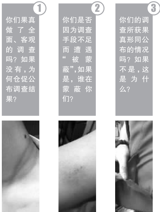
空姐微博上贴出受伤照片。

官方回应与旅客指证的大相径庭，不仅让网友疑云骤起，也引发媒体质疑。9月2日11时25分，新华社广东分社官方微博三问越秀区委宣传部：