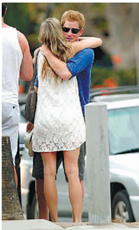
22日，哈里在洛杉矶一停车场与神秘女子拥别。