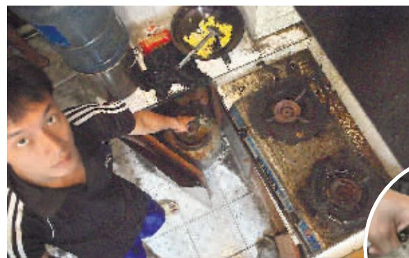
8月22日,长沙市新塘龙小区,伤者的儿子小周介绍当时的情况。