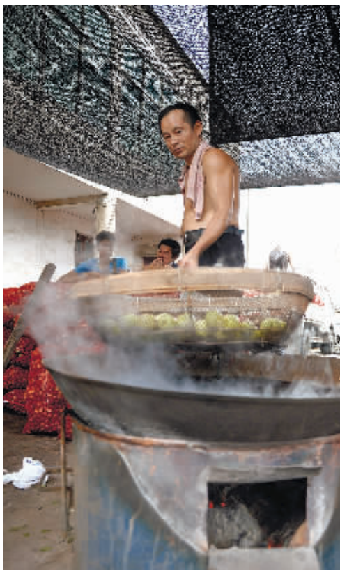
一工人正把未成熟的青枣放入开水里加工。