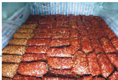
大枣浸泡在塑料布围成的池子里。