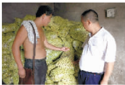
8月21日,湘潭一大枣催熟窝点被查。