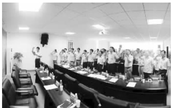
公司庆祝建党91周年暨创先争优总结表彰会集体重温入党誓词。

关重要的一年，如何扩大一体化成果，加快煤电项目建设；如何深入参与资源整合，提高煤炭产能；如何加快攸能文化建设，建设温馨之家，都是摆在该公司面前亟待解决的问题。为此，该公司将以“管理提升年”为契机，对标杆，攻短板，练内功，努力把正在干的事情干得更好，优质、高效地完成各项工作，全力以赴打造湘军名片、集团明星企业，用“一流的团队、一流的标准、一流的发展模式”交一份圆满答卷，为集团公司做强做优、向世界一流迈进贡献力量。