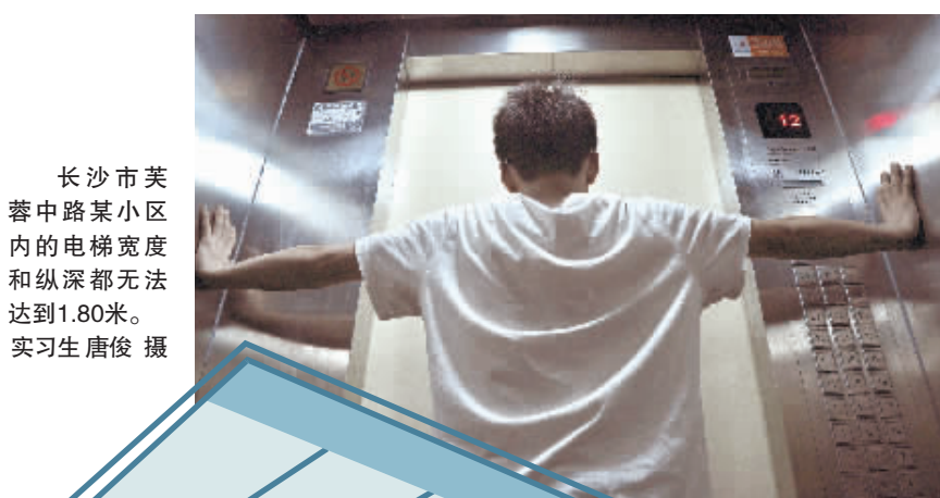
长沙市芙蓉中路某小区内的电梯宽度和纵深都无法达到1.80米。