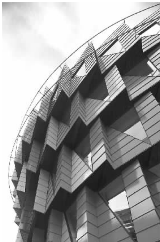
图为一栋节能环保建筑。窗户三角形设计减少日晒,屋顶上有太阳能板,采用自然通风和照明系统,有助于减少能源使用。

双托村的变化仅仅是我省强力推进城镇污水垃圾处理设施建设的缩影。易继红表示,自2008年以来,我省相继新建119座污水处理厂和5500公里管网,新增污水日处理能力401.1万吨,到2010年实现全省县城以上城镇污水处理设备全覆盖。除此之外,自2009年开始实施城镇生活垃圾无害化处理设施建设,新建102座生活垃圾无害化处理厂,新增日处理能力2.7万吨,2012年底将实现县以上城镇生活垃圾无害化处理设施全覆盖。