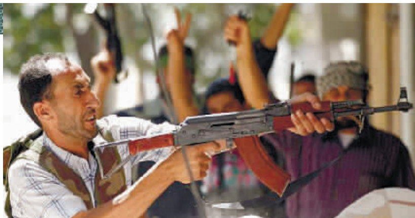
在与政府军的冲突中，一名“叙利亚自由军”成员举枪开火。

“叙利亚电子军”频频发力，一些支持反对派的黑客以类似方式回击。一名“推特”用户6日谣传巴沙尔“可能遇害或者受伤”。这条微博随后在互联网迅速传播，一度影响国际市场原油价格。