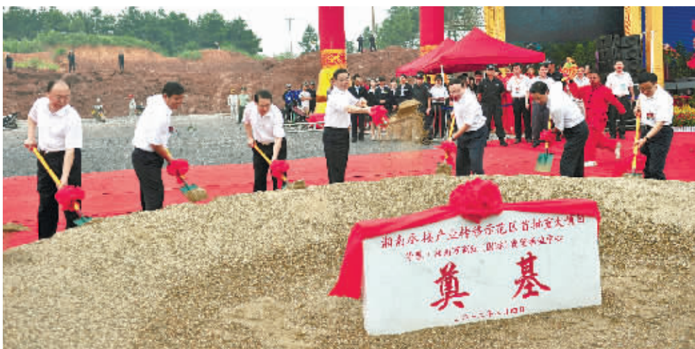
8月4日，省委书记、省人大常委会主任周强等领导为永州市万商红(国际)商贸物流中心项目奠基。