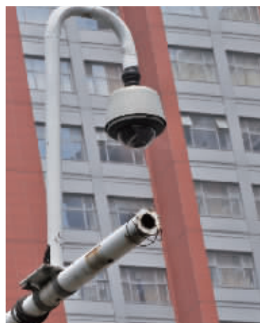
8月3日,长沙市湘雅医院门口的电子警察监控器。