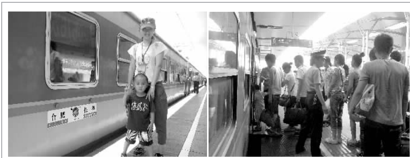
7月1日首发式当天，获邀免费体验的旅客在长沙上车。

L206/5次列车开通后，在湘求学的安徽学子，在安徽上大学的湖南学子，都将这趟直达列车作为回家的首选。同时，到安徽经商、务工的人员也偏爱这趟车。许先生在合肥接了一单装修生意，7月份4次乘坐该车往返长沙和合肥两地。他感叹：“又方便又便宜！发车时间都在中午，不用起早贪黑；硬座91元，硬卧也才170多元，很划算。” ■本版撰文 记者 赵伟 唐能 通讯员 袁建平 实习生 彭紫微