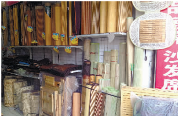
长沙市蔡锷北路一家凉席专卖店,麻将凉席躺在店内最不显眼的一角。