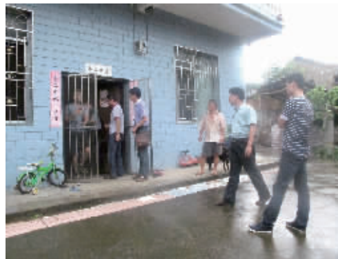
这几天，老王家院子里客人络绎不绝。