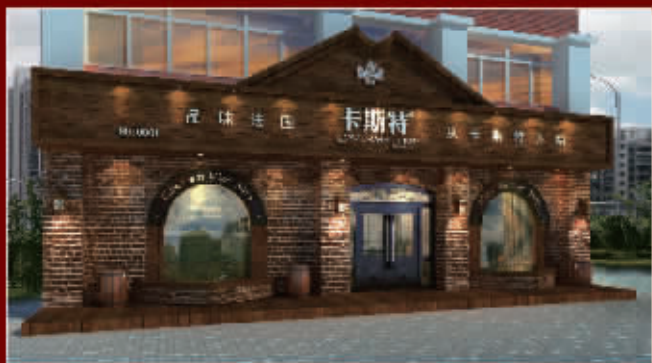
认准商机,是一种大智慧!

如今的酒类市场被贴上暴利行业的外衣以后,风云变动的白酒业亦要调整其策略。卡斯特红酒的入驻,无疑为长沙的酒业注入了新的活力。高品质的红酒,不仅为长沙的酒业注入了新的活力,更是对长沙酒业的一次革命。卡斯特红酒的入驻,不仅为长沙的酒业注入了新的活力,更是对长沙酒业的一次革命。卡斯特红酒的入驻,不仅为长沙的酒业注入了新的活力,更是对长沙酒业的一次革命。