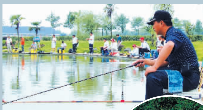
烟波浩淼的东江湖(左图);游客在千龙湖专心垂钓(右图)。

避开滚烫的夏天、闷热的城市、丛林的高楼,寻找夏日里的一抹绿意,回归山水不失为一个好的选择。在青山绿水间,聆听鸟音婉转;在清风拂面中,徜徉山水美景。憩静的村落掩映在青山翠竹之间,岸边怪石嶙峋,山鸟鸣翠,艇下溪流湍急,一波三折,更有那迎风扑面夹着绿野芳香的清新空气,令人心旷神怡。或许,这个夏天,你也可以畅游山水间,偷得浮生半日闲。