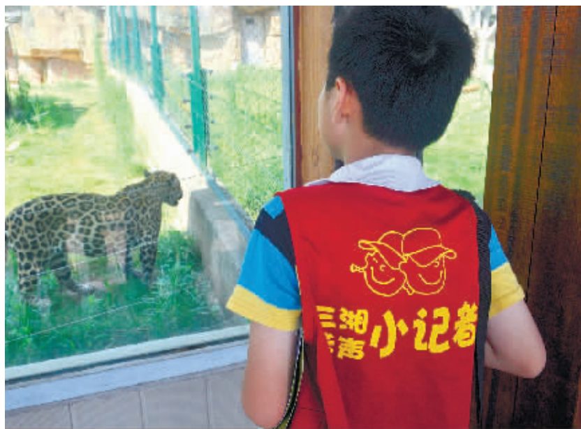
小记者参观长沙生态动物园里的豹子。 实习生 李健 摄