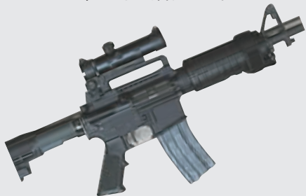
▲AR-15半自动步枪：性能可靠，适于近距离内杀伤目标，再加上霍姆斯专门为此配备的100发超大弹匣，更增大了其威力。