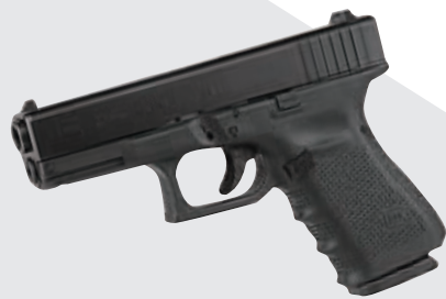
▲“格洛克”手枪：重量轻、射速快，是奥地利军队标准武器，也被多国警方采用。