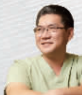
金相泰(韩) 亚洲眼鼻整形权威