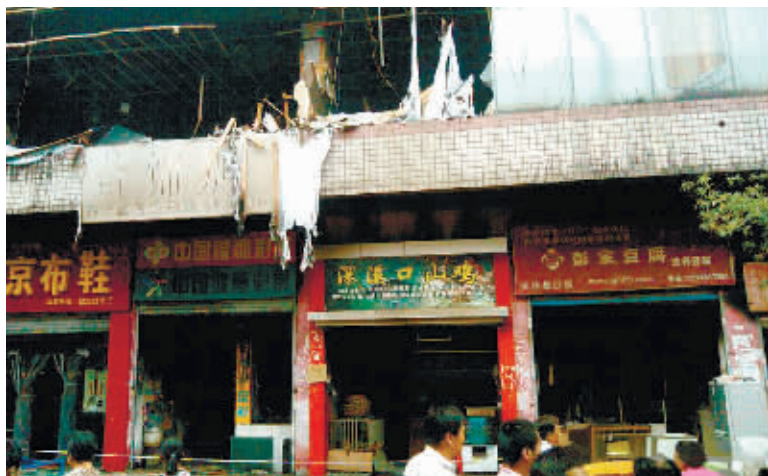
发生火灾的聚鑫大厦，一、二层多户商家受到影响。