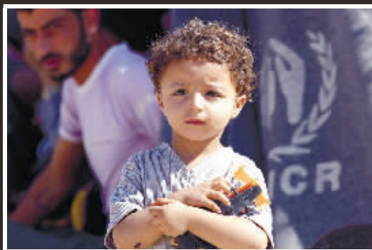
7月17日，一名躲避战火的叙利亚儿童在约旦临近叙利亚边界难民营。