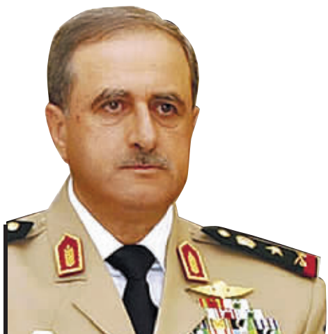
叙国防部长拉杰哈遇袭身亡。